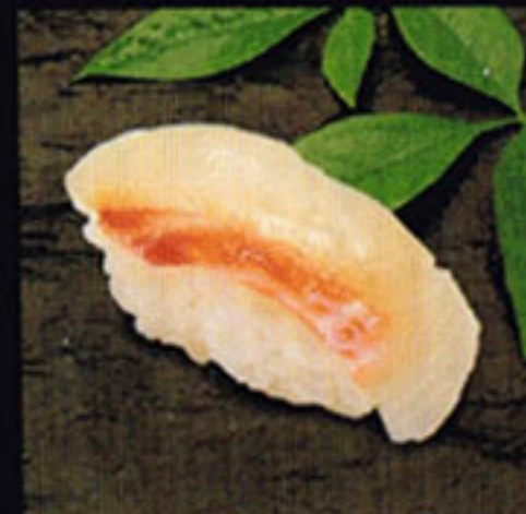
Red Snapper Tai [tie] 鯖魚 / 도미