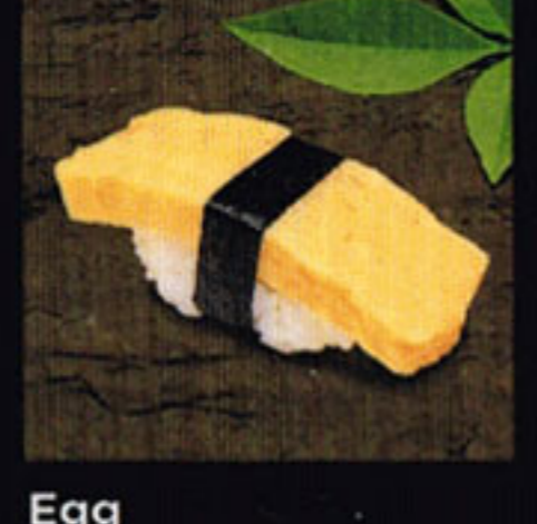
Egg Tamago [ta-mo-go] 煎蛋 / 계란말이