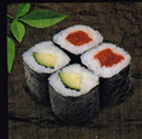
Tuna Roll Tekka Maki [tek-ka ma-ki] 鮪魚捲 / 참치 말이