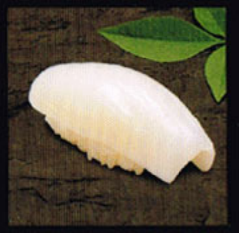
Squid Ika [e-keh] 花枝 / 오징어