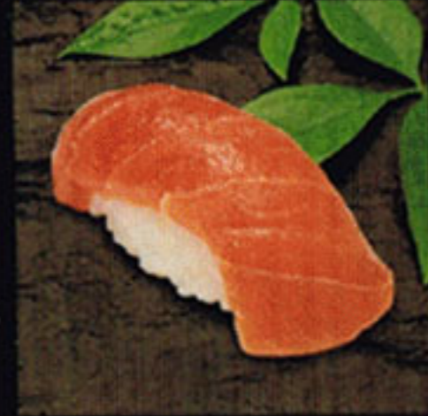
Marbled Tuna Toro [toh-ro] 鮪魚腹 / 참치 맛살