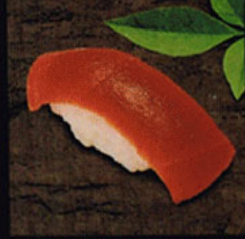
Tuna Maguro [ma gu-ro] 鮪魚 / 참치