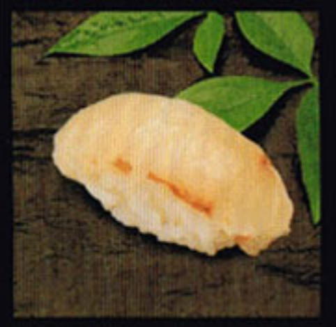
Halibut Hirame [he rah-meh] 比目魚 / 광어