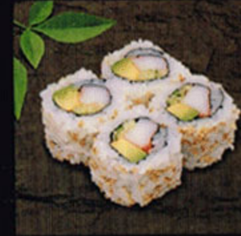
California Roll 加州捲 / 캘리포니아 롤