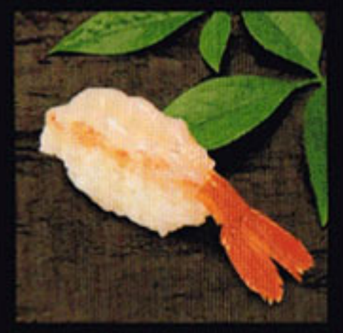
Sweet Shrimp Amaebi [ah-mo eh-bee] 甜蝦 / 단새우