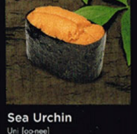
Sea Urchin Uni [oo-nee] 海膽 / 성게알