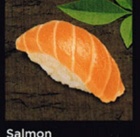
Salmon Sake [sah-ke] 鮭魚 / 연어