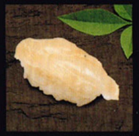
Giant Clam Mirugai [mee-roo guy] 西施舌 / 용우럭 조개