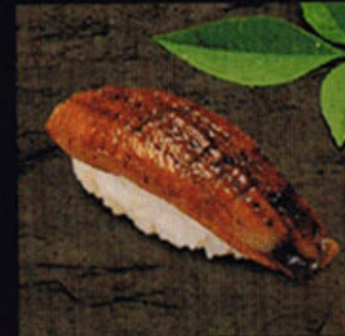
Freshwater Eel Unagi [oo na-ghee] 鰻魚 / 인몰장어