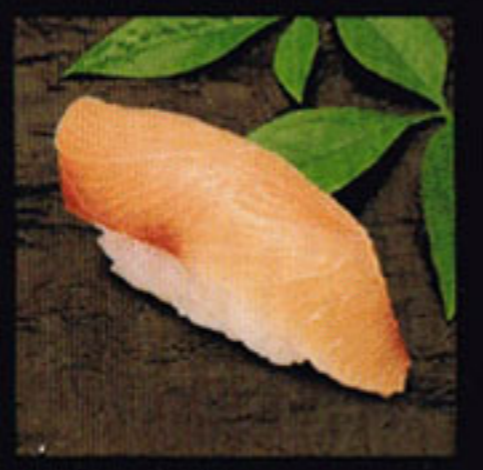
Yellowtail Hamachi [ha-mo-chee] 青鮪 / 망어