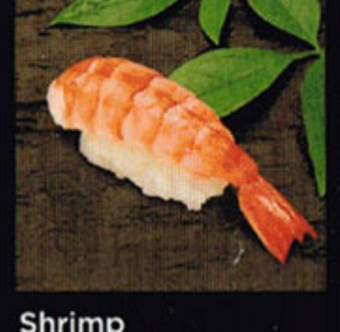
Shrimp Ebi [eh-bee] 鮮蝦 / 새우