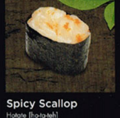
Spicy Scallop Hotate [ho-ta-teh] 干貝 / 가리비