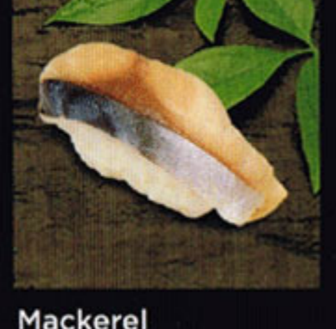
Mackerel Saba [sa-bah] 青花魚 / 곶등어