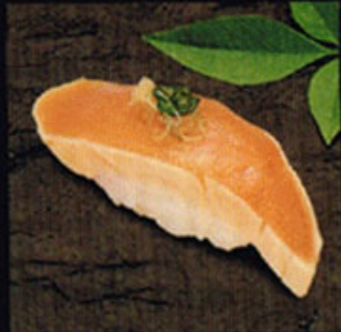
Albacore Shiramaguro [she-ro ma gu-ro] 白鰯魚 / 희살참치