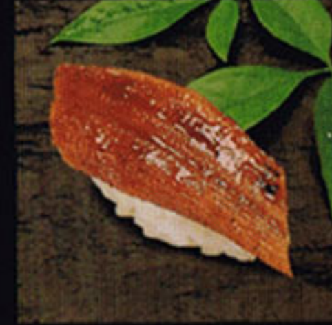
Saltwater Eel Anago [ah-na-go] 星鰻 / 장어