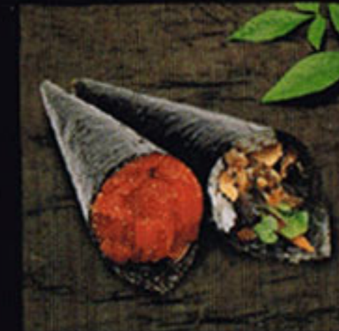
Salmon Skin Roll 鮭魚皮捲 / 연어껍질 말이